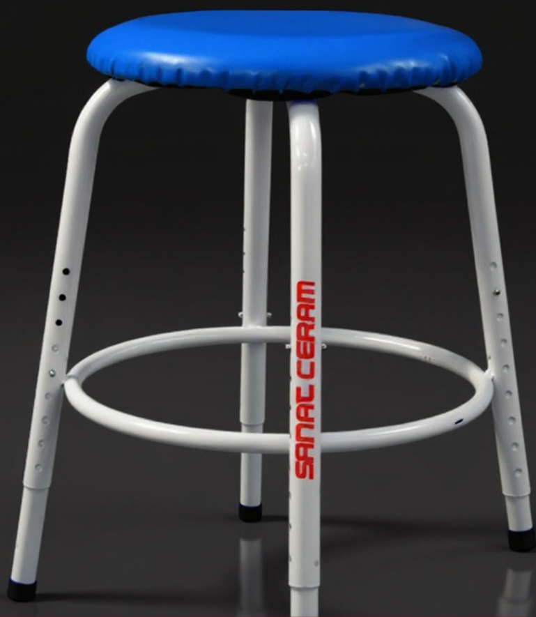
POTTERY WHEEL STOOL